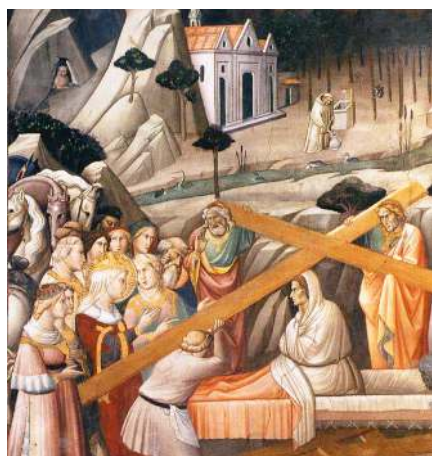
Художник Аньоло Гадди. Фреска из храма Креста Господня, Флоренция, XIV век. Фрагмент

Император Константин Великий очень хотел найти Крест, на котором три века назад был распят Спаситель. В 326 году он направил в Иерусалим экспедицию во главе со своей матерью Еленой. Поиски оказались успешными: в земле под Голгофой обнаружили три креста. Чтобы узнать, на каком из них был распят Спаситель, к каждому по очереди поднесли недавно умершего человека.