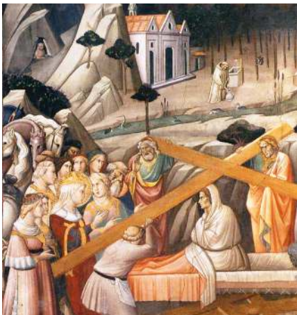
Художник Аньоло Гадди. Фреска из храма Креста Господня, Флоренция, XIV век. Фрагмент

Император Константин Великий очень хотел найти Крест, на котором три века назад был распят Спаситель. В 326 году он направил в Иерусалим экспедицию во главе со своей матерью Еленой. Поиски оказались успешными: в земле под Голгофой обнаружили три креста. Чтобы узнать, на каком из них был распят Спаситель, к каждому по очереди поднесли недавно умершего человека.