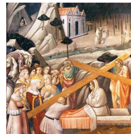
Художник Аньоло Гадди. Фреска из храма Креста Господня, Флоренция, XIV век. Фрагмент

И Господь явил чудо: возложенный на один из крестов покойник воскрес! Узнав об этом, к Голгофе прибыло множество людей, и иерусалимский архиепископ Макарий несколько раз поднял ( воздвиг ) Честное Древо Креста ввысь, чтобы все могли увидеть святыню.