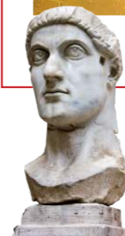
Равноапостольный император Константин (272–337). Он направил экспедицию на поиски Креста Господня

Молящиеся на иконе символизируют собою христиан всех времен и народов, поклоняющихся спасительному подвигу Христа