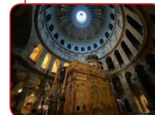
Храм Воскресения Христова (Гроба Господня). Возведен по приказу императора Константина на месте распятия и погребения Христа. На самом деле царица Елена (+327) не дождала до окончания строительства. Храм освятили в 335 году. Дата освящения храма и стала днем праздника Воздвижения Креста Господня

Молящиеся на иконе символизируют собою христиан всех времен и народов, поклоняющихся спасительному подвигу Христа