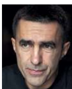
Вячеслав Бутусов (род. в 1961 году)

Советский и российский киноактер, известный по роли советского разведчика Исаева-Штирлица в фильме «Семнадцать мгновений весны». Также сыграл учителя истории в фильме «Доживем до понедель- ника», Андрея Болконского в картине Сергея Бондарчука «Война и мир» и множество других знаменитых ролей.