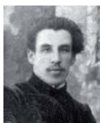
Священномученик Вячеслав Луканин (1882–1918)

Регент и диакон. Имел замечательные музыкальные способности, организовывал хоры и певческие курсы. Последним местом его служения стал Спасо-Пре- ображенский собор при Невьянском заводе Екатеринбу- ргской епархии. В августе 1918 года отец Вячеслав был жестоко замучен и расстрелян красноармейцами. При- числен к лику новомучеников и исповедников Русской Церкви. День памяти — 16 августа.