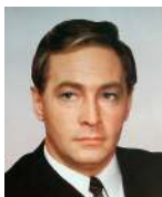
Вячеслав Тихонов (1928–2009)

Советский и российский киноактер, известный по роли советского разведчика Исаева-Штирлица в фильме «Семнадцать мгновений весны». Также сыграл учителя истории в фильме «Доживем до понедель- ника», Андрея Болконского в картине Сергея Бондарчука «Война и мир» и множество других знаменитых ролей.