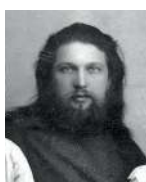
Священномученик Вячеслав Закедский (1879–1918)

Регент и диакон. Имел замечательные музыкальные способности, организовывал хоры и певческие курсы. Последним местом его служения стал Спасо-Пре- ображенский собор при Невьянском заводе Екатеринбу- ргской епархии. В августе 1918 года отец Вячеслав был жестоко замучен и расстрелян красноармейцами. При- числен к лику новомучеников и исповедников Русской Церкви. День памяти — 16 августа.