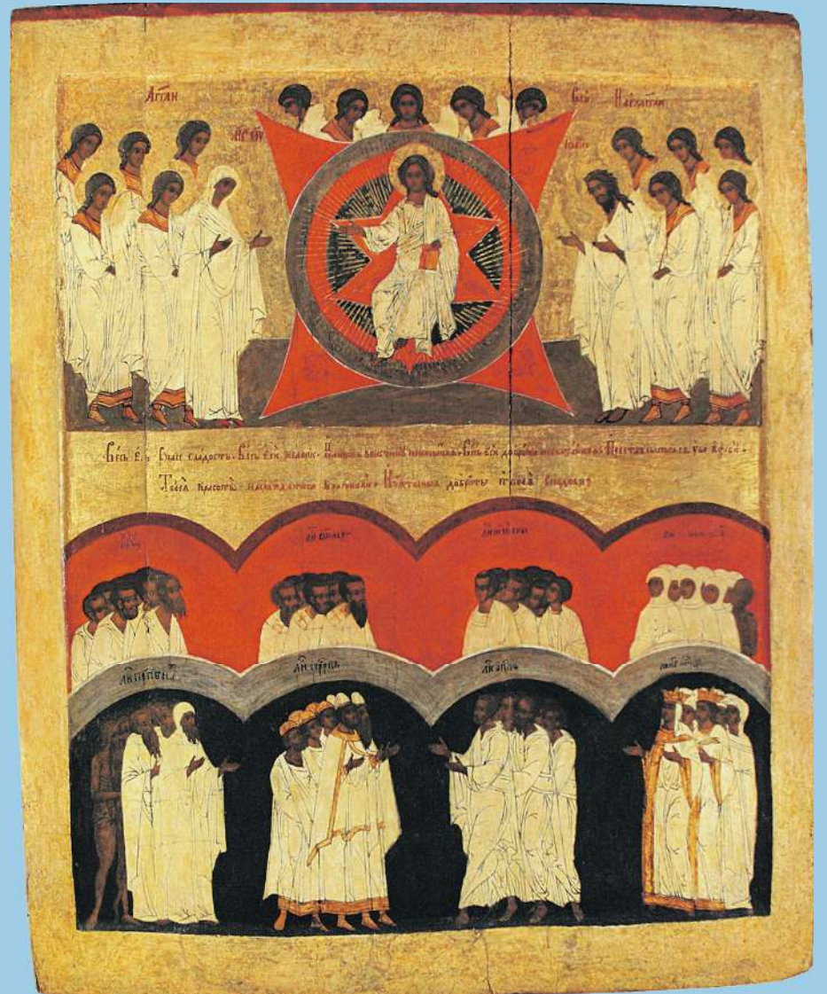
Икона «Собор всех святых». Православная Церковь празднует этот праздник в первое воскресенье после дня Святой Троицы. Этот день можно считать именинами всех христиан.

«С именинами!» — когда праздник святого, в честь которого назвали. «С Днем ангела!» — когда дата крещения. Но никто не обидится, если вы поздравите «С Днем ангела!» в день именин. ☩.