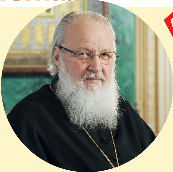
Патриарх Московский и всея Руси Кирилл

Философ Блез Паскаль писал: «Есть только два типа людей: праведники, считающие себя грешниками, и грешники, считающие себя праведниками...» «Человека нельзя сделать святым без благодати, а тот, кто сомневается в этом, не знает ни что такое святость, ни что такое человек». Человек имеет внутри себя склонность к греху, об этом очень ясно говорит апостол Павел (см. Рим. 7:14-25). Притяжение греха обусловлено тем, что человек не живет по Божиим заповедям. Наш отказ жить по Божию закону создает некую внутреннюю трещину в целостной природе человека. Это как здание с трещиной: вот оно стоит и может долго простоять; а если тряхнет, здание с трещинами падает.