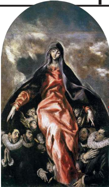
Образ написан Эль Греко в 1603 году для алтаря храма больницы де ла Каридад города Ильескас (Испания), где и находится по сей день.

«Всех скорбящих Радость» — чудотворный образ Богородицы, почитаемый в Русской Православной Церкви.