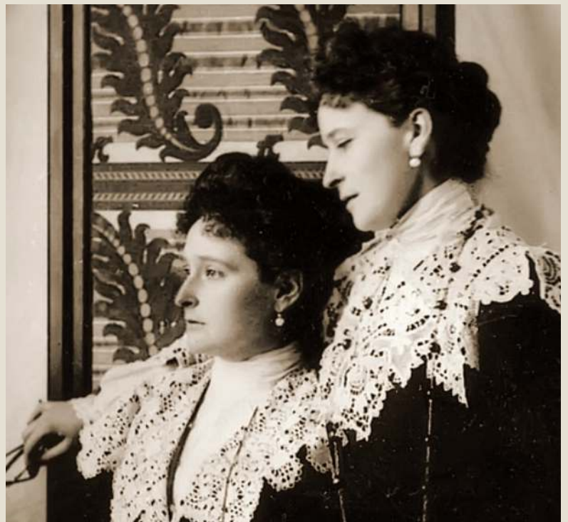
Александра Федоровна и Елизавета Федоровна причислены Русской Православной Церковью к лику святых.

Подпись ручкой на бирке с обратной стороны подушечки: «Вышивка. Е. И. В. Государыни Императрицы Александры Федоровны. Акварель Е. И. В. Великой Княгини Елизаветы Федоровны».