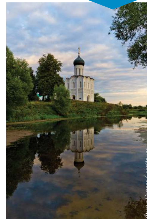
Церковь во имя Покрова Пресвятой Богородицы на Нерли построена князем Андреем Боголюбским

В Византии некоторое время это событие отмечалось ежегодно, но до празднования в рамках всей греческой Церкви дело не дошло. А вот наши предки поступили иначе: в честь явления Богоматери во