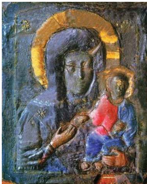
Влахернская икона Божией Матери была привезена в дар царю Алексею Михайловичу. Хранится в Третьяковской галерее. Влахернская церковь Богородицы не сохранилась

На рассвете, когда богослужение подходило к концу, Андрей увидел в воздухе под сводами собора женскую фигуру, которая в окружении ангелов и святых шествовала над головами собравшихся в церкви людей. Это была Богородица. Достигнув середины храма, Она опустилась на колени и стала со слезами молиться своему Сыну. Молитва Ее была долгой и пламенной. Затем, продолжая молитву, Пречистая Дева приблизилась к алтарю и там провела еще некоторое время. Когда же Она стала покидать храм, то сняла со своей головы омофор и распростерла его над верующими.