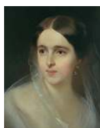
Наталя Николаевна Гончарова (1812–1863)

Вторая супруга царя Алексея Михайловича, мать Петра I. Провинциальная дворянка по происхождению, познакомилась с вдовым царем через своего родственника Артамона Матвеева. За пять лет брака родила царю троих детей — Петра, Татьяну и Феодору. Имела жизнерадостный нрав, покровительствовала придворному театру, в котором ставили спектакли на библейские сюжеты. Оказала большое влияние на Петра.