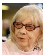
Наталия Ивановна Басовская (1941–2019)

Супруга Александра Сергеевича Пушкина, из потомственных дворян. По мнению части биографов поэта, стала невольной виновницей его гибели, поскольку не пресекла вовремя ухаживания Жоржа Дантеса. Смерть Пушкина стала для Наталии Николаевны тяжелым потрясением. До конца жизни она носила в пятницу, когда умер муж, траур, никуда не выходила и не принимала пищу. После семи лет вдовства вышла замуж за генерала Петра Ланского.