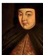
Наталя Кирилловна Нарышкина (1651–1694)