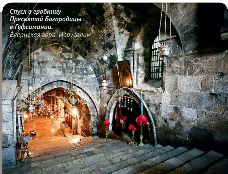
Спуск в гробницу Пресвятой Богородицы в Гефсимании. Елеонская гора, Иерусалим

Апостол Петр совершает каждение телу Усопшей