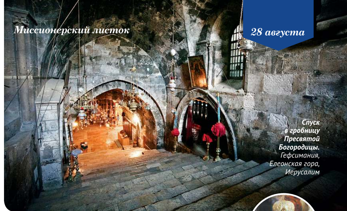
Спуск в гробницу Пресвятой Богородицы. Гефсимания, Елеонская гора, Иерусалим

Подготовлено Комиссией по миссионерству и катехизации при Епархиальном совете г. Москвы при поддержке проекта «Православный вестник» Синодального отдела по взаимоотношениям Церкви с обществом и СМИ и православного журнала «Фома» www.foma.ru