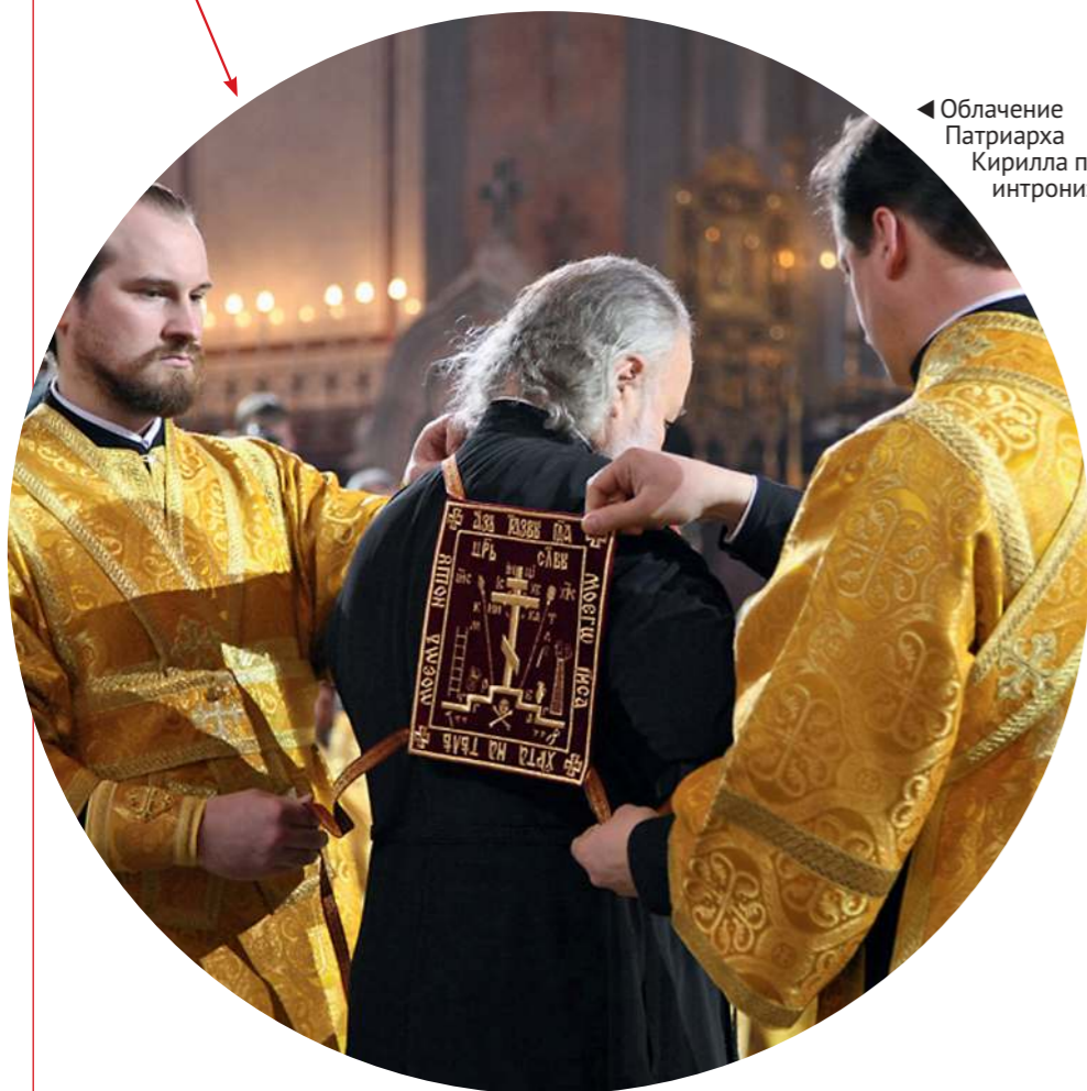
Облачение Патриарха Кирилла перед интронизацией

Великий — носит Патриарх Московский и всея Руси, надевая его поверх подрясника только перед богослужением.