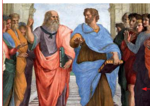
Афинская школа. Фрагмент. Рафаэль Санти

Василий начал изучение наук. Позднее он отправился в училище в Кесарии, где познакомился и подружился с будущим святым Григорием Богословом. Высшее образование Василий получил в Константинополе, где учился у знаменитого ритора Ливания. А затем отправился в тогдашнюю «обитель наук» — Афинскую академию, которая была основана самим Платоном в 390-х годах до Р. Х. После окончания учебы Василий какое-то время проработал адво-