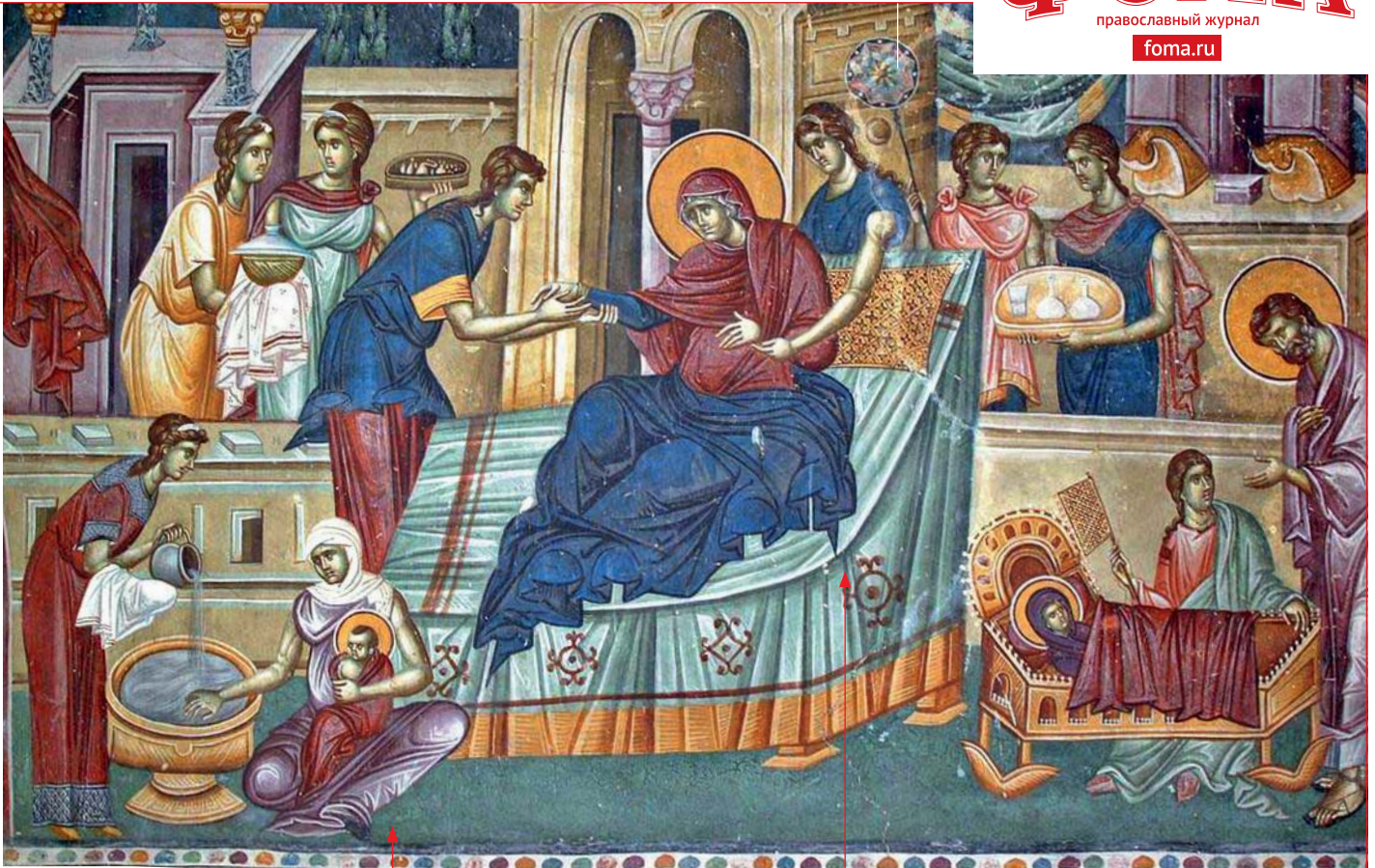
Служанки омывают новорожденную Марию в купели и качают колыбель.