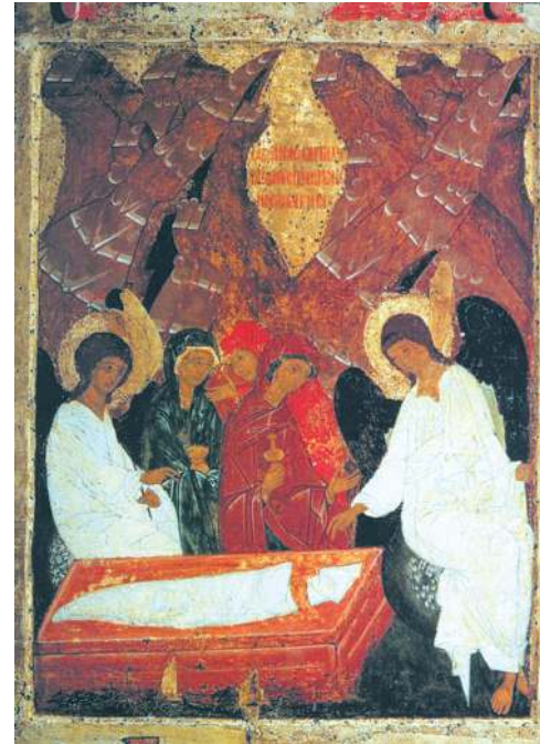
Мироносицы у Гроба

Раскопки, производимые в Иерусалиме, позволили обнаружить ряд подтверждений евангельской истории. Так, еще в XIX столетии была найдена купальня Вифезда, о которой идет речь в Евангелии от Иоанна (см. Ин 5:2). В 1961 году в