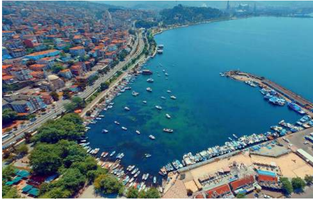
▲ Город Эргли в Турции — бывшая Гераклея

в свой двор, чтобы лично почтить их жертвами. Как только его просьба была удовлетворена, святой велел изрубить драгоценные изваяния на мелкие кусочки и раздать их нищим. Феодор прекрасно понимал, что его ждет после того, как все откроется. Своим поступком он хотел утвердить в вере недавно крестившихся горожан и продемонстрировать императору бессилие язычества.