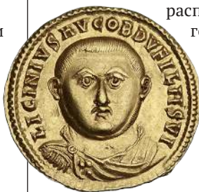
◀ Монета императора Лициния. 4 век н. э.

Лицинию доложили об успехах Феодора в Гераклее. Чтобы расправиться с неугодным подчиненным, Лициний приказал вызвать его