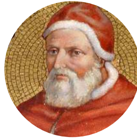
Папа Григорий XIII. Мозаика

Особенности: юлианский год — 365 дней и 6 часов, разделен на 12 месяцев. Через каждые 4 года объявляется високосный год (добавляется 1 день — 29 февраля), благодаря чему разница в часах сводится на нет.