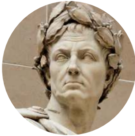
Юлий Цезарь. Скульптор Кусту, 1698 г.