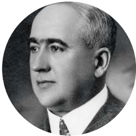
Милутин Миланкович. Фото начала XX в.

В мае 1923 года в Константинополе состоялся собор Православных восточных Церквей, созванный патриархом Мелетием IV. На нем был обсужден календарный вопрос и принято решение о реформе. Чтобы не принимать григорианский календарь, было решено ввести календарь, названный новоюлианским.