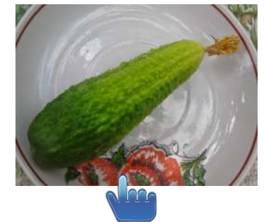
Фото автора огурца

1 раз в год минимум редакция угощается фирменными солеными огурцами Виталия Марковича.