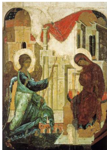
Благовещение. Икона Андрея Рублева. 1405

На иконе Благовещения изображается явление архангела Гавриила Деве Марии, видимое удивление которой показано в соединении с глубочайшим смирением перед всемогуществом Бога. Над архангелом и Марией располагается особая форма нимба — мандорла, которая символизирует Божественное явление и зачатие Христа. Красная нить в руках Марии — это пряжа, которой, по церковному преданию, она занималась в этот великий для всей Церкви день.