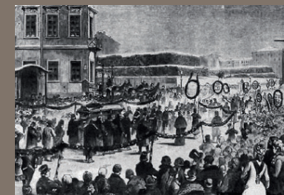
Похороны Ф. М. Достоевского. Рисунок В. Порфирьева. 1881