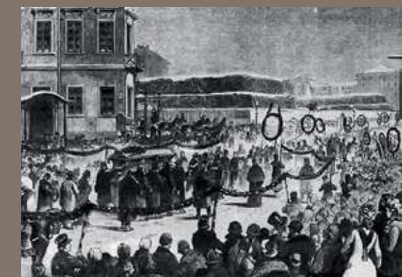
Похороны Ф. М. Достоевского. Рисунок В. Порфирьева. 1881