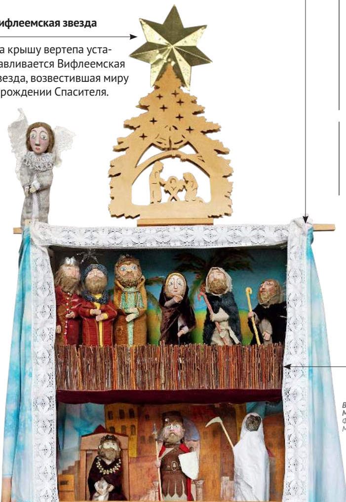
Вертеп Маши Макаровой.

На крышу вертепа устанавливается Вифлеемская звезда, возвестившая миру о рождении Спасителя.