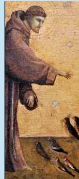
Святой Франциск проповедует птицам. Джотто ди Бондоне. Около 1300

Создание вертепа как панорамной композиции с сюжетом Рождества Христова некоторые ученые приписывают католическому святому Франциску Ассизскому (XIII в.). По другой версии, они появились гораздо раньше — в V веке, во времена Папы Римского Сикста III.