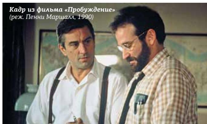
Кадр из фильма «Пробуждение» (реж. Пенни Маршалл, 1990)

— Нет, это вы на себя посмотрите! Болезнь вырвала меня из мира. Но я хотя бы боролся за возвращение. Тридцать лет боролся. Тридцать долгих лет! И до сих пор борюсь. А вот у вас — нет оправдания. Вы просто испуганный одинокий человек. У которого ничего нет, никакой жизни. Это вы — спите!