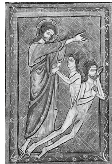
Сотворение Адама и Евы. Миниатюра из Библии, 1230 г.

Интересно еще и то, что в греческом тексте этого фрагмента сказано, что Бог навел на Адама буквально не глубокий сон, а ekstasis — выход из себя. И отрывок можно читать и так, что Адам уснул после «этого выхода из себя». Получается, что именно в результате выхода вне себя из до того единого человека и была сотворена женщина. При этом человек в состоянии экстаза не видит, как происходит